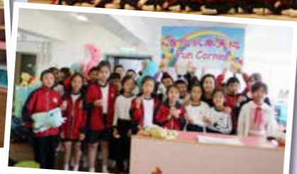
同學們在「百欣歡樂天地」玩得很開心