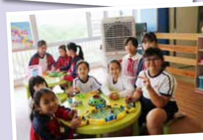
「百欣歡樂天地」玩具區

學校一向重視同學德育方面的發展，引入正向教育，於不同層面正面培育同學，營造學校的正向校園文化。本年度推行「正向好學生獎勵計劃」，給學生喜悅活潑的體驗，營造正向的學習氛圍。學校於九月家長日為家長舉辦「正向教育」講座，讓爸爸、媽媽都一同多讚賞、多鼓勵我們。此外，學校為我們設計了精美的「正向好學生」Passport，每周由科任老師和家長為我們蓋章，對我們的好表現給予肯定。此外，學校更定期為我們預備精彩、有趣的獎勵活動以及別出心裁的禮物，叫我們既驚喜，又期待。