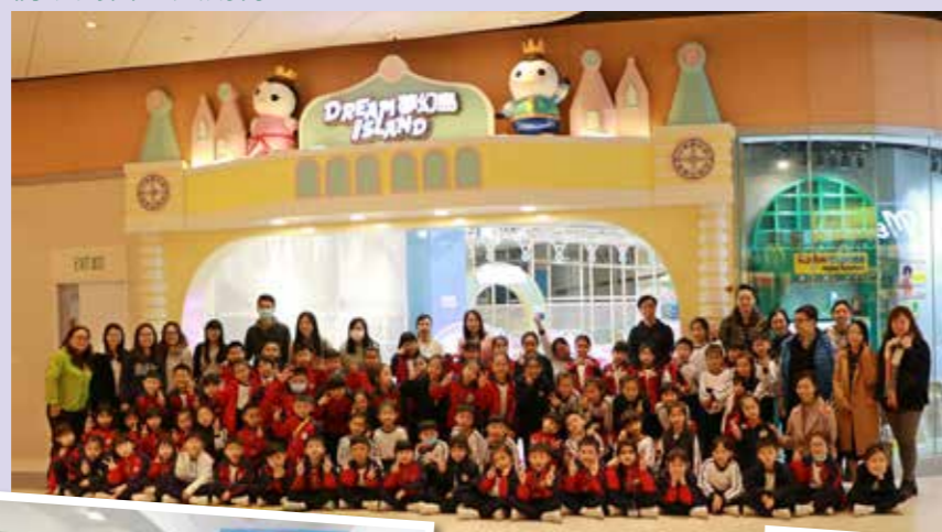
上學期終極獎勵活動：一至三年級到 Dream Island 波波池玩得十分開心。

學校一向重視同學德育方面的發展，引入正向教育，於不同層面正面培育同學，營造學校的正向校園文化。本年度推行「正向好學生獎勵計劃」，給學生喜悅活潑的體驗，營造正向的學習氛圍。學校於九月家長日為家長舉辦「正向教育」講座，讓爸爸、媽媽都一同多讚賞、多鼓勵我們。此外，學校為我們設計了精美的「正向好學生」Passport，每周由科任老師和家長為我們蓋章，對我們的好表現給予肯定。此外，學校更定期為我們預備精彩、有趣的獎勵活動以及別出心裁的禮物，叫我們既驚喜，又期待。