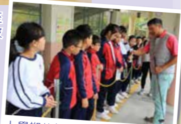
上學期終極獎勵活動：四至六年級到屯門高爾夫球中心打球。