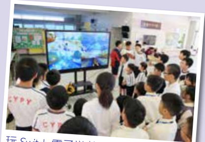
玩 Switch 電子遊戲機