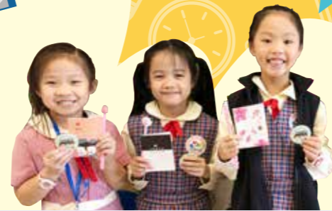
學生手持正向學生襟章及豐富的小禮物