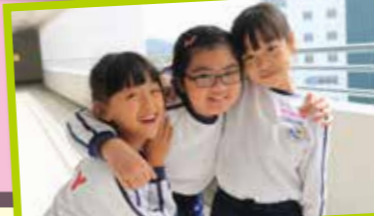
大哥哥大姐姐計劃

小導師在午休時間幫助一、二年級同學學習，指導同學中、英文科認字及數學科的簡單運算。