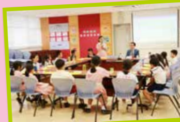
百欣智囊團午餐會議